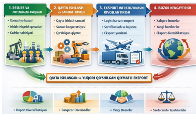
1-rasm. Hudud eksport salohiyatini kompleks rivojlantirishning integratsiyalashgan modeli

Aniqlangan muammolarni bartaraf etish hudud eksport salohiyatini rivojlantirishga kompleks va tizimli yondashuvni talab etadi. Shu nuqtayi nazardan, tadqiqot natijalari asosida hudud eksport salohiyatini rivojlantirishning integratsiyalashgan modeli taklif etiladi. Ushbu model resurslar, ishlab chiqarish imkoniyatlari, infratuzilma va tashqi bozorlar oʻrtasidagi uzviy bogʻliqlikka asoslanadi.